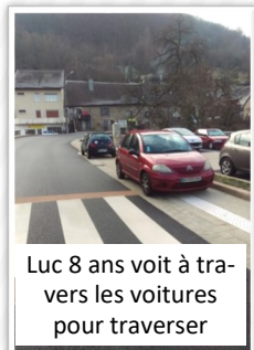
Luc 8 ans voit à travers les voitures pour traverser

Le stationnement est interdit en dehors des places de stationnement réglementaires. Un stationnement sur un trottoir, même de courte durée, représente un danger pour les piétons, les personnes à mobilité réduite ou pour le passage des poussettes. Ce type d'infraction est sanctionné par une amende allant de 35€ à 135€.