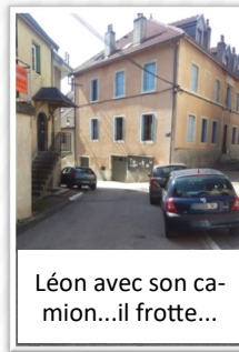
Léon avec son camion...il frotte...