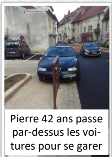
Pierre 42 ans passe par-dessus les voitures pour se garer