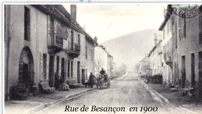
Rue de Besançon en 1900

ATTENTION : Vous partez en vacances ? Pensez à vérifier les documents d'identité de toute la famille. En effet, le délai d'attente pour un rendez-vous dans les mairies équipées de dispositif de recueil peut être assez long. Les mairies équipées de dispositif de recueil les plus proches de Beure, sont : Ornans, Quingey, école valentin, Sâone, Saint Vit ou Besançon.